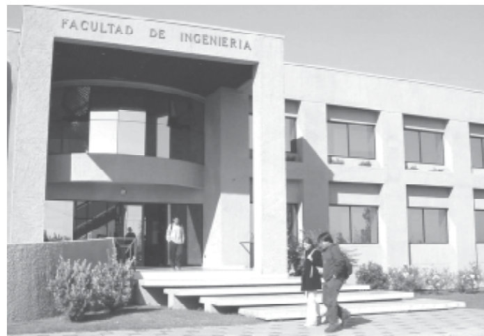
Alumnos de los primeros años de las carreras que se imparten en el Campus Curicó participarán en talleres para el desarrollo personal organizados por la Universidad de Talca.

mer día de cada encuentro, los estudiantes conocerán las vivencias de alumnos de cursos superiores, quienes compartirán durante algunas ho-