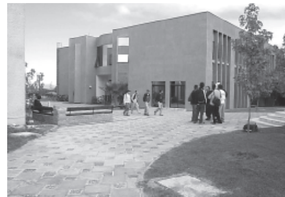
La Facultad de Ingeniería ubicada en el Campus Curicó inaugurará su año académico, el próximo miércoles.

La inauguración de este nuevo Año Académico se realizará el miércoles 26 de Abril, a las 12:00 horas, en el Auditorio de la Facultad de Ingeniería, ubicado en el Campus Curicó. Y se espera la presencia de gran parte de la comunidad universitaria y algunas autoridades de la zona que fueron invitadas al acto.