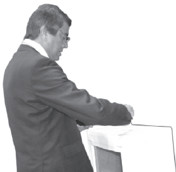
El Ministro de Agricultura, Álvaro Rojas concurrió muy temprano a sufragar.

El 18 de abril de 2006 pasará a la historia de esta casa de estudios superiores y muchas de sus imágenes quedarán en la retina de los miembros de esta comunidad universitaria.