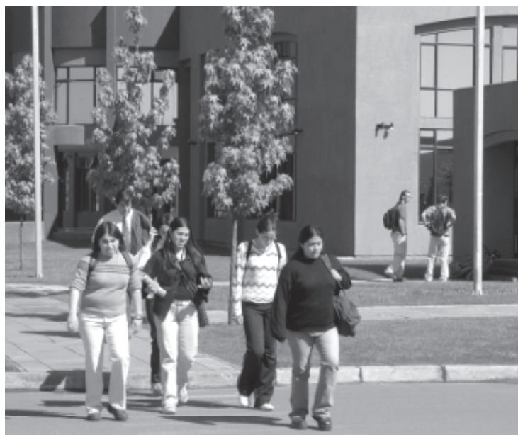
El Rector de la Universidad de Talca consideró que la nueva Ley de Acreditación permitirá tanto a los actuales como futuros educandos un conocimiento certificado, respecto de cómo una universidad se desempeña en el campo académico.

Para la autoridad, el nuevo cuerpo legal permitirá que la sociedad conozca el desempeño de cada una de las entidades de educación superior, lo cual posibilita que aquellas universidades que están trabajando en forma seria y que están guiadas por un afán de mejoramiento sostenido de la calidad van a ser efectivamente reconocidas a través de las instancias acreditadoras. “En el caso de nuestra Universidad, hace muchos años que estamos trabajando por lograr excelencia en el desarrollo de todas nuestras actividades académicas, por lo tanto creemos que el funcionamiento del sistema de acreditación nacional nos va a permitir tener un reconocimiento al modo en que hemos venido trabajando, lo cual nos permitirá diferenciarnos de muchas entida-