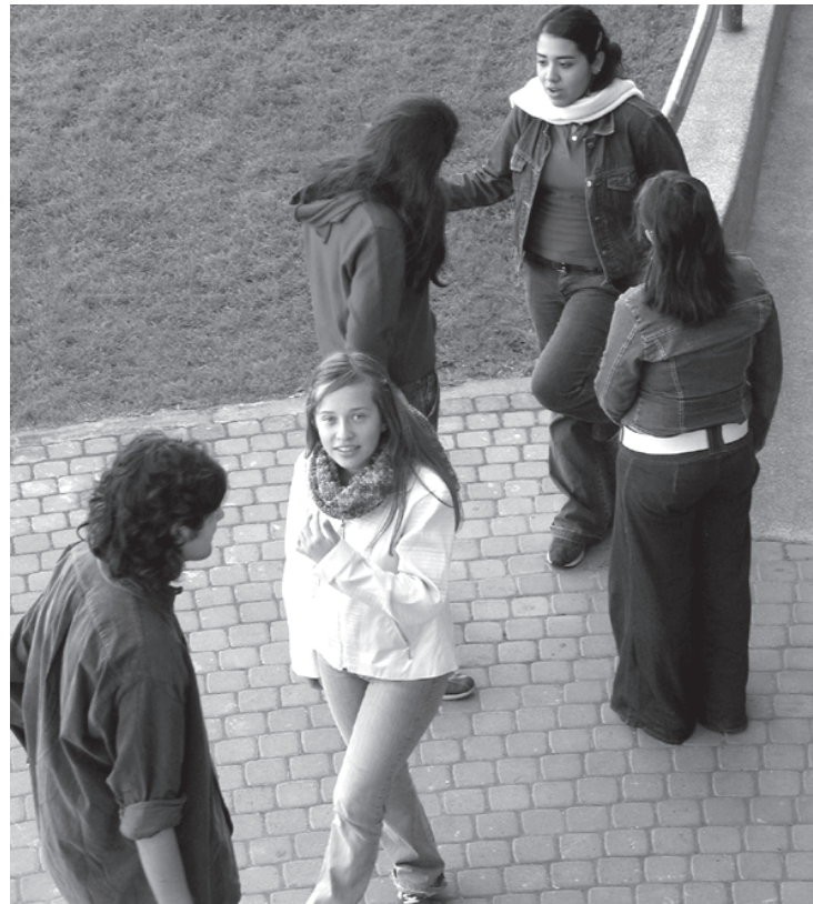
Los estudiantes de la Universidad de Talca podrán cursar un semestre en cualquier institución del Consorcio de Universidades Estatales.

Para acceder a esta iniciativa, los estudiantes deberán tener la calidad de alumnos regulares de las carreras de pregrado en una de las universidades pertenecientes al Consorcio de Universidades Estatales de Chile. Del mismo modo, los postulantes deberán haber aprobado el primer año de su plan de estudios de su carrera, quedando excluidos los alumnos del último curso.