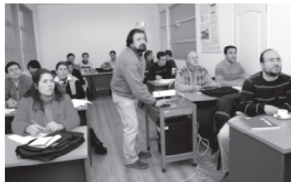
Profesionales y técnicos de la zona centro y sur del país participan en el Diplomado en Riego Tecnificado.