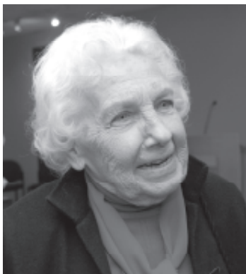
La escultora Lily Garafulic presenta sus obras en la Sala de Exposiciones del Campus Santiago.

Asimismo, Garafulic enfatizó que su labor refleja el viaje interminable, refiriéndose específicamente a las piezas que fueron seleccionadas para la exposición, la escultora señaló que se trata de una gestación que se ha dado año tras