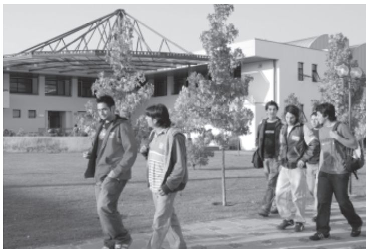
El Consejo Académico acordó implementar un nuevo sistema de ingreso al pregrado. De esta manera, se verán beneficiados estudiantes de alto rendimiento durante la educación media.

Informó que para el proceso de admisión 2007, el Consejo Académico determinó que un total de once carreras se acogieran a este sistema, entre las cuales figuran Ingeniería Forestal, Agronomía, Contador Público y Auditor, Ingeniería Comercial, Ingeniería Informática Empresarial, Arquitectura, Diseño, Música (requiere de prueba especial) Ingeniería Mecánica,