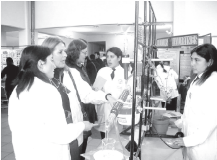
Un total de 72 trabajos participarán en la XVI versión de la Feria Científico-Tecnológica del Maule, que tendrá lugar a fines de mes en el Campus Talca.

Entre los proyectos seleccionados, 40 corresponden a grupos de enseñanza media y 22 a básica y por comunas, 43 son de Talca, ocho de Curicó e igual número de San Javier, seis de Linares, tres de