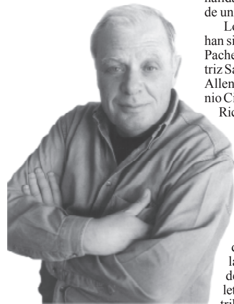
António lobo Antunes ganó Premio Iberoamericano de Letras "José Donoso" en su versión correspondiente a este año.

En definitiva, el jurado concluyó que su trabajo es una "aportación excepcional a la literatura ibe-