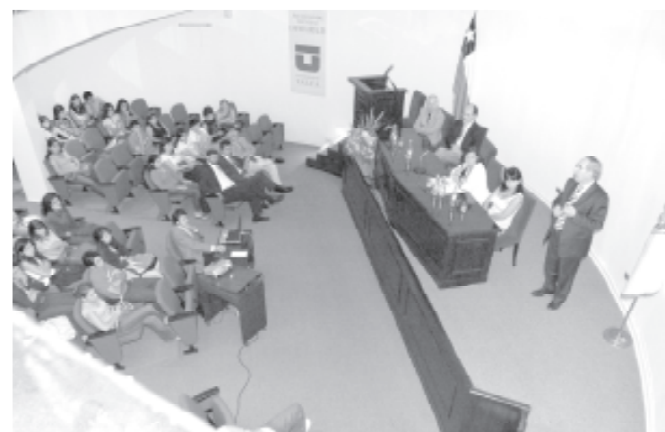
Contador Público y Auditor, Ingeniería Informática Empresarial e Ingeniería Comercial fueron recibidos en el auditorio de la FACE.