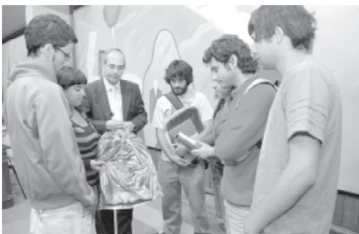
Los estudiantes recibieron una mochila y la agenda de la Universidad.

En todos los actos, la autoridad destacó los programas extracurriculares que realiza la Universidad de Talca, y llamó a los nue-