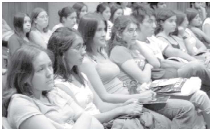
Los estudiantes escucharon atentamente los saludos de la FEDEUT y de las autoridades universitarias.