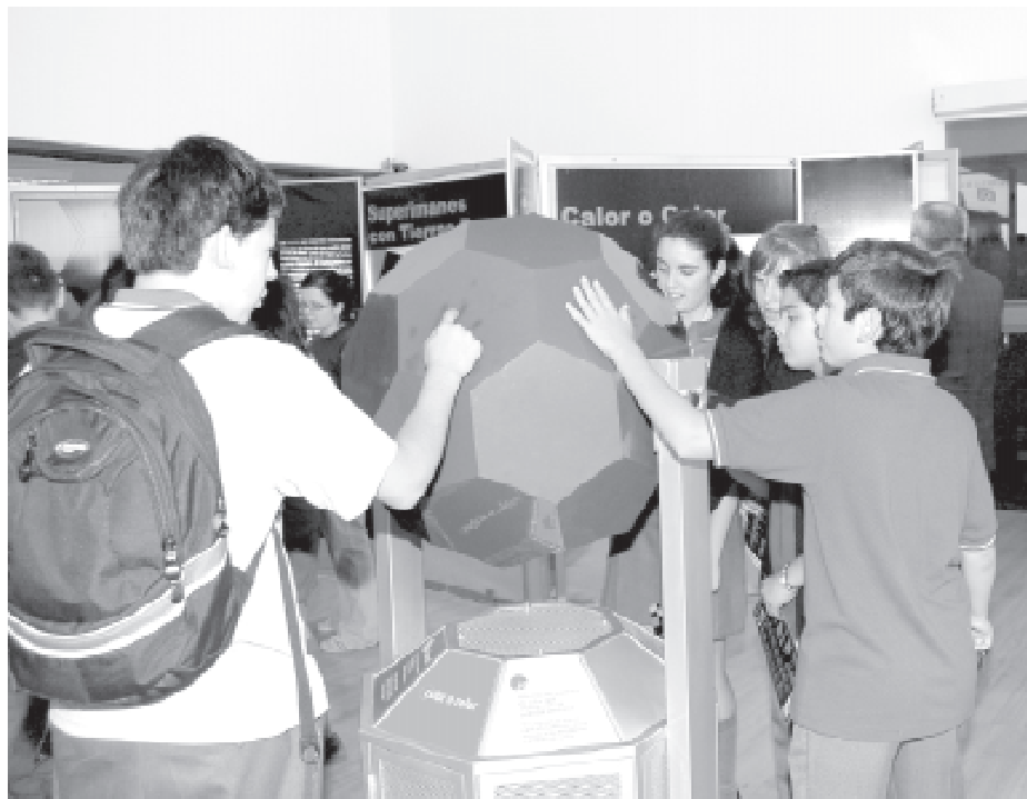
La superficie de esta figura cambia de color con la temperatura de la mano. Uno de los atractivos de la muestra instalada en el centro de extensión “Pedro Olmos”.

En ese contexto, observó que EXPLORA – CONICYT contribuye a consolidar en los niños el amor por esa actividad. Finalmente, agradeció que la Universidad de Talca actúe como un nexo entre el Programa EXPLORA y la juventud maulina.