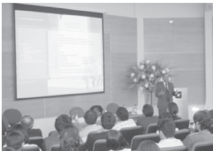
El rector Rock viajó a Curicó para saludar a los novatos de la Facultad de Ingeniería.

Por último, reiteró que las puertas de FEDEUT están abiertas para todos y para lo que necesiten.