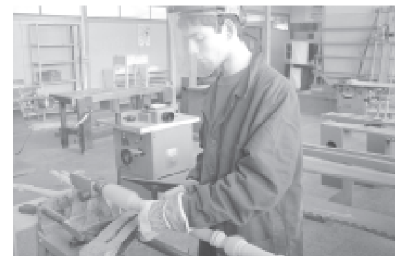
El Centro Regional de Tecnologías de la Industria de la Madera (CERTIM) de la Universidad de Talca lidera la Red Madera.

presentantes del sector maderero del Maule, para que valoren la importancia de esta actividad que benefician tanto a las empresas como a sus trabajadores. "En este sentido el aporte de las empresas es vital, puesto que con su participación en los talleres se considerarán sus necesidades reales en los futuros programas de formación y capacitación", enfatizó.