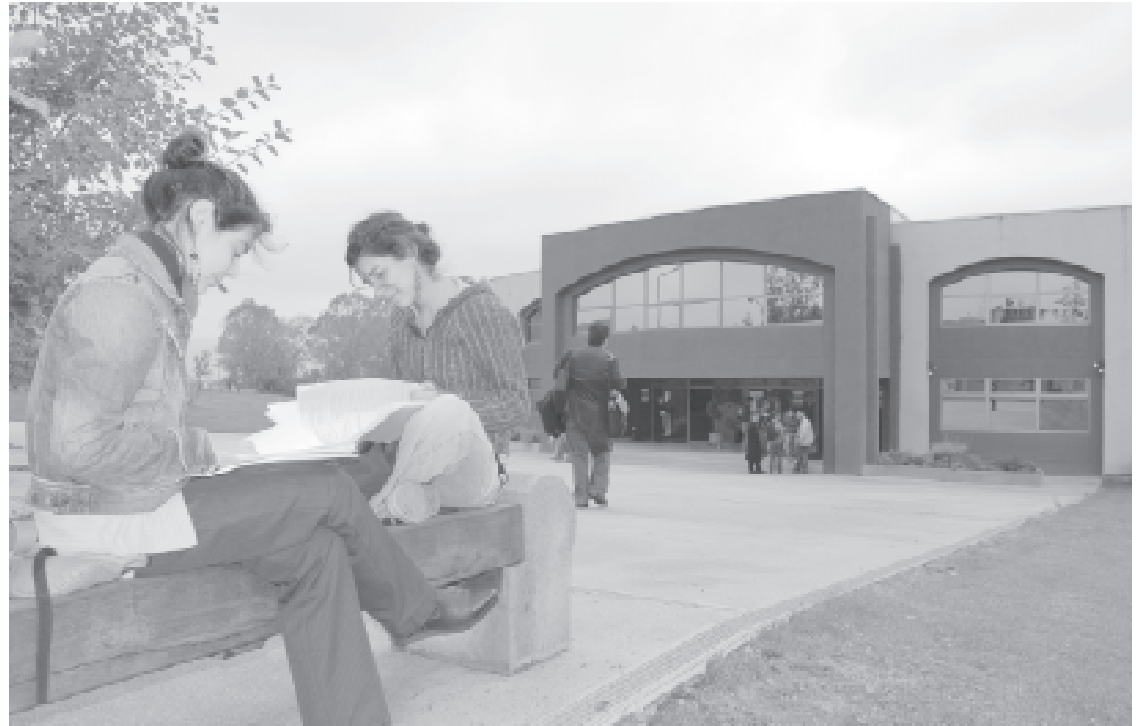
Frontis de la Facultad de Psicología.

Por el momento no se ha realizado el anuncio a la comunidad estudiantil de la Escuela de Psicología, y se espera que próximamente se realice una comunicación oficial y la correspondiente celebración, asunto que debe re-