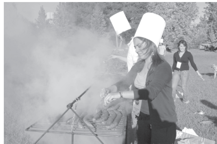
"La Choripanada más grande de Chile" puso el toque culinario a la Semana Mechona de la FEDEUT"