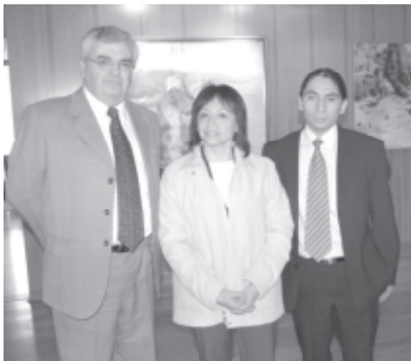
La Universidad de Magallanes vino a conocer la experiencia para implementar el mismo sistema.